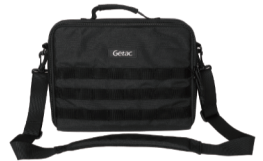
持ち運び用バッグ