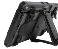
ハンドストラップ